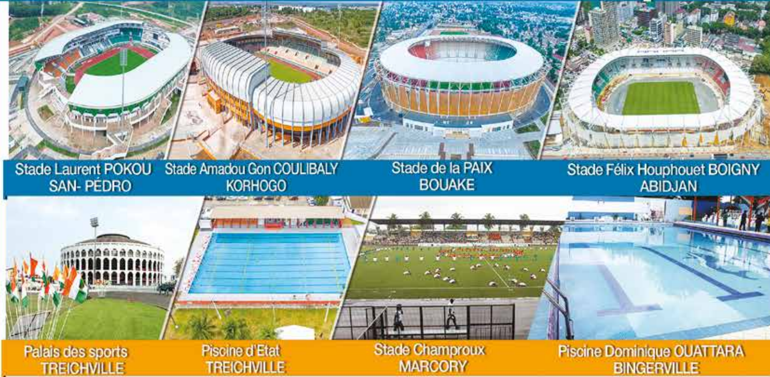
Stade Laurent POKOU SAN- PÉDRO