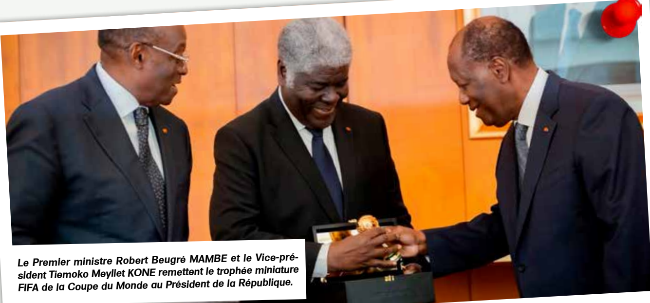
Le Premier ministre Robert Beugré MAMBE et le Vice-président Tiemoko Meyliet KONE remettent le trophée miniature FIFA de la Coupe du Monde au Président de la République.