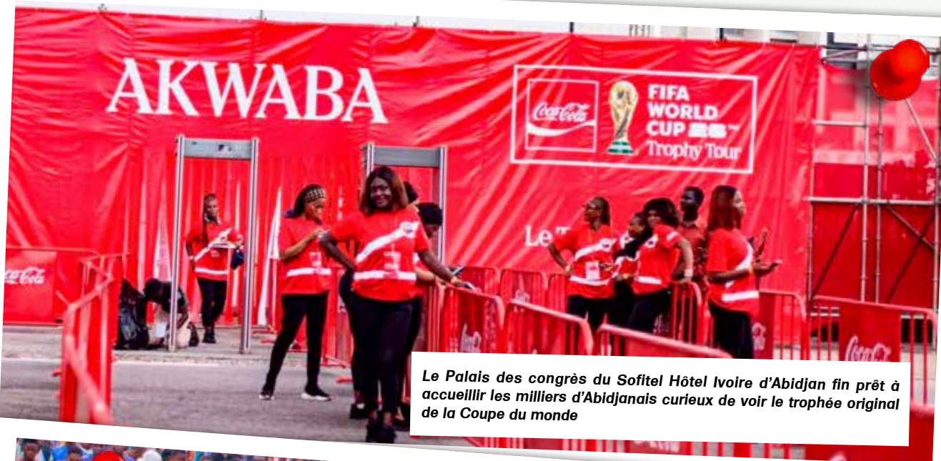
Le Palais des congrès du Sofitel Hôtel Ivoire d'Abidjan fin prêt à accueillir les milliers d'Abidjanais curieux de voir le trophée original de la Coupe du monde