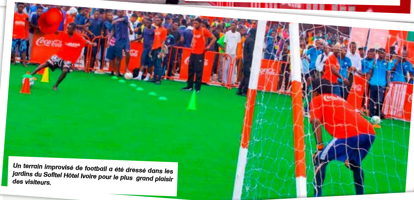
Un terrain improvisé de football a été dressé dans les jardins du Sofitel Hôtel Ivoire pour le plus grand plaisir des visiteurs.