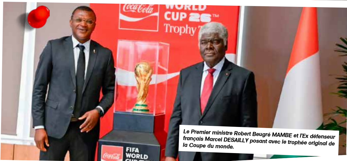
Le Premier ministre Robert Beugré MAMBE et l'Ex défenseur français Marcel DESAILLY posant avec le trophée original de la Coupe du monde.