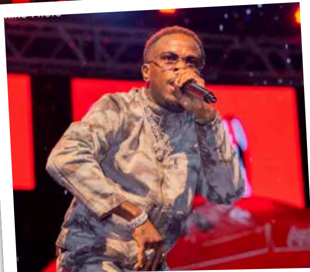
Didi B, était sur scène pour le concert organisé en fin de journée par Coca Cola. Les fans ont vibré au son de ses hits.